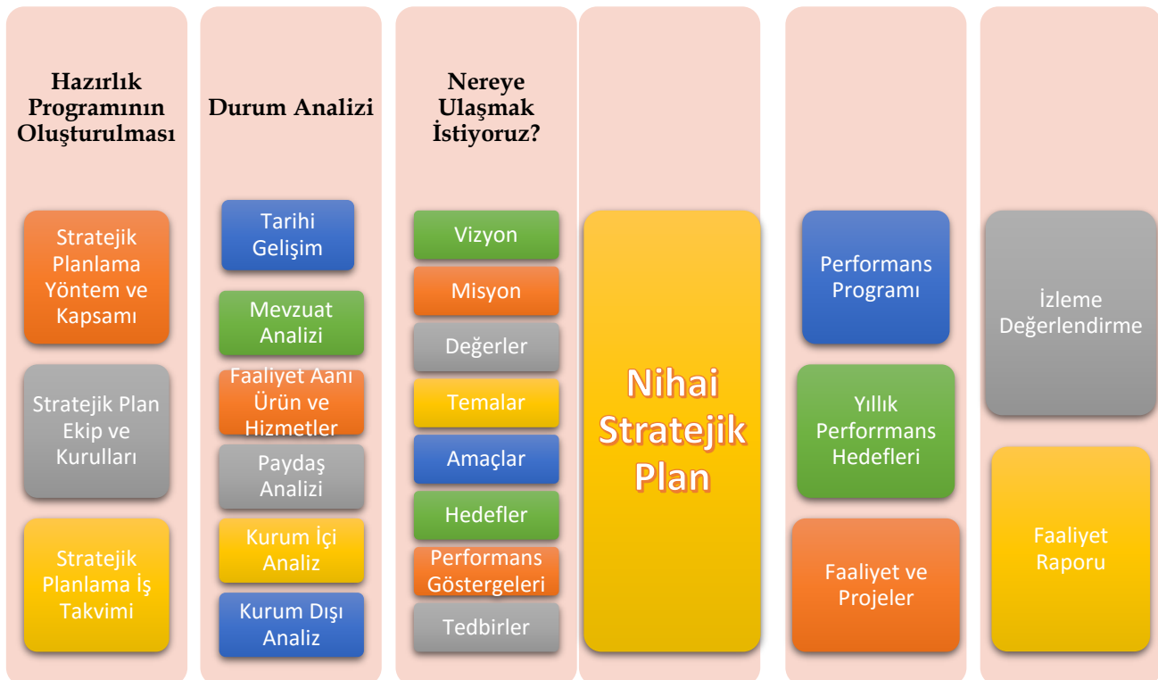
Şekil 1: İl M.E.M Stratejik Planlama Modeli

Çankırı İl Milli Eğitim Müdürlüğü plan çalışmalarında tüm paydaşların etkin katılımının sağlanması, eğitim adına öncelikler oluşturulması ve bakanlığımızın oluşturduğu tema başlıklarını destekleyecek bir yapı içerisinde olunması benimsenmiştir.