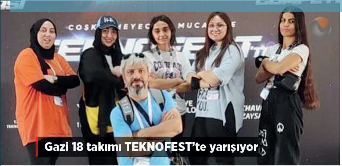
Gazi 18 takımı TEKNOFEST'te yarışıyor

T ürkiye Teknoloji Takımı Vakfı (T3 Vakfı) ve T.C. Sanayi ve Teknoloji Bakanlığı'nın yürütücülüğünde, Türkiye'de milli teknolojinin geliştirilmesi konusunda kritik rol oynayan birçok kuruluşun paydaşlığıyla düzenlenen Türkiye'nin ilk ve